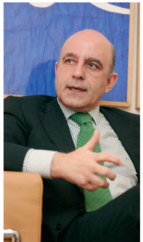
Zarzalejos piensa que Internet gana terreno a otros medios. DSG

R.- En el PP hay una parte que lo está haciendo razonablemente bien, y otra muy mal. La falta de transparencia, la falta de una comunicación transparente en la Comunidad de Madrid, pre-ocupa a empresarios, a medios de comunicación y a los ciudadanos. Aún así, da la sensación de que el PP tiene recursos de renovación, como se ha puesto de manifiesto tras elecciones en el País Vasco y en Galicia.◆