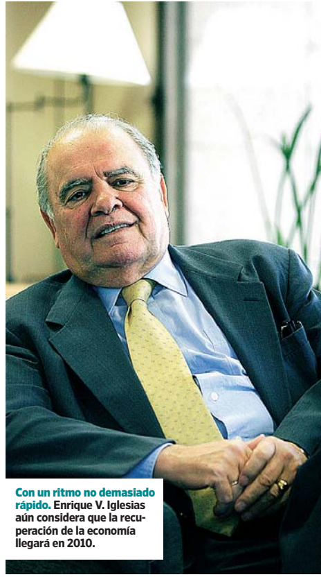
Con un ritmo no demasiado rápido, Enrique V. Iglesias aún considera que la recuperación de la economía llegará en 2010.

les 13 tiene elecciones a la vista. También muestra su temor por como afectarán a las economías de América Latina la reducción de las remesas económicas enviadas por los emigrantes en países extranjeros o la inminente reunión del G-20 en Londres que definirá la estructura de la economía global y el papel de las potencias emergentes en un futuro próximo. ■ P27